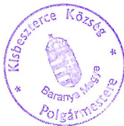
Szűcs Róbert Sándor polgármester